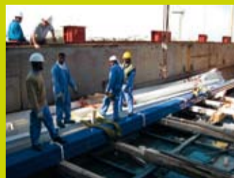
Lossen haven Doha.