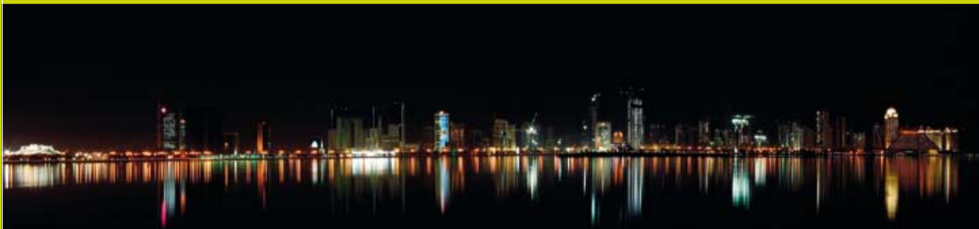
Skylines Doha. De Corniche Doha by night

80 kilometer ten noorden van Doha, ter hoogte van Ras Laffan – de industrial city van Qatar, bouwt Frijns Industrial Group in een joint venture een Ship Repair Yard.